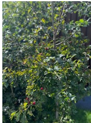
2 Inheemse beplanting

Bomen, heesters en bloemen - Bomen spelen een centrale rol op het park, gezien hun bijdrage aan biodiversiteit en hun praktische functies zoals schaduw en erfafscheiding. De Klepperstee gaat zorgvuldig om met bomen; alleen bij hoge uitzondering worden dode of gevaarlijke bomen verwijderd, en altijd in overleg. Verwijderde bomen worden vervangen door inheemse soorten. Jaarlijks worden de bomen gecontroleerd op veiligheid, met een driejaarlijkse inspectie door een extern bedrijf. Heesters, die beschermen tegen wind en erosie, zijn van groot belang voor het behoud van het landschap en bieden schuilplaatsen voor dieren. Bloemenmengsels en kruidige grassen dragen bij aan bodemgezondheid vormen een dynamische, kleurrijke insecten aantrekt.