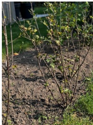
4 Schoffelen zorgt voor een droge en arme grond