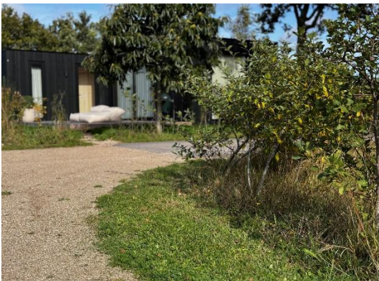
3 Klavermengsel onder de heester zorgen voor groei

De grensbeplanting en bomen hoef je zelf niet te onderhouden. Sterker nog wij willen niet dat je dit onderhoudt, omdat de TD van De Klepperstee dit doet en het beste weet hoe dit moet onderhouden en deze strook zo gezond mogelijk blijft.