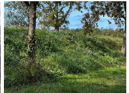
1 Zandwallen landschap op het park