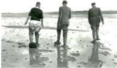
Uit de Kampioen van juni 1970

Toen ruim 47 jaar geleden de bouw van Bungalowpark De Bremerberg werd opgestart was dat op een bijzondere plek in Nederland: de vroegere bodem van de Zuiderzee. Oostelijk Flevoland was pas 15 jaar daarvoor drooggevallen en had dus nog een nog jonge geschiedenis.